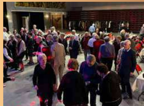
Soirée de la Saint Sylvestre