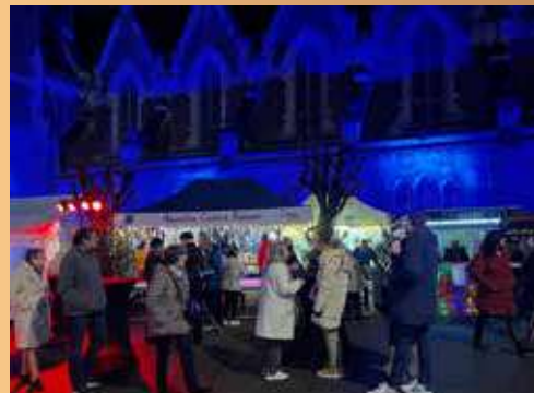
Noël d'Artois 2025