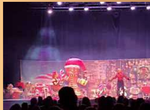
Spectacle de Noël