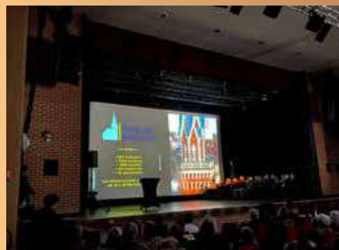
Cérémonie des vœux 2026