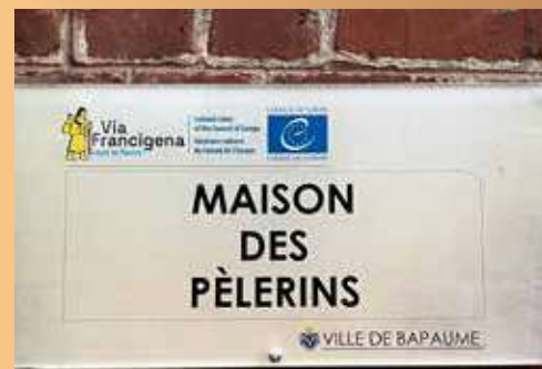
Inauguration de la maison des pèlerins